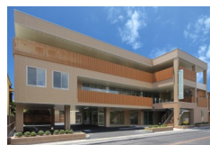
メンタルクリニック心と

※午前のみ「大塩駅」、「ひめじ別所駅」から送迎車両あり 車をご利用の方 姫路バイパス 上下線ともに別所ランプ